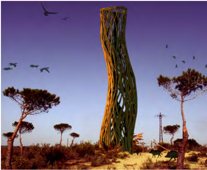
Torre en la Loma del Chocolate