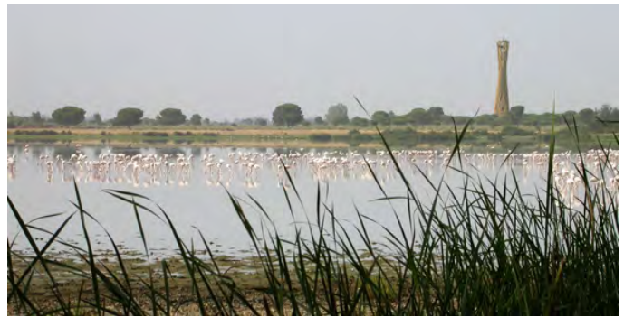
Torre en Manecorro