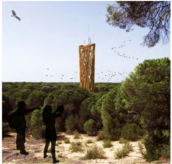
Torre en el Pinar de Marismillas