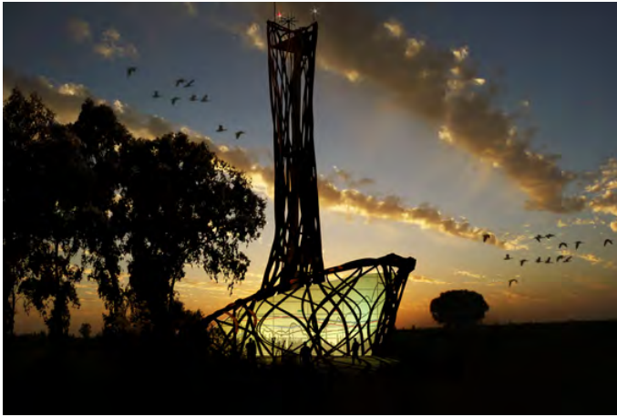
Torre Palacio de Doñana - Situation Room