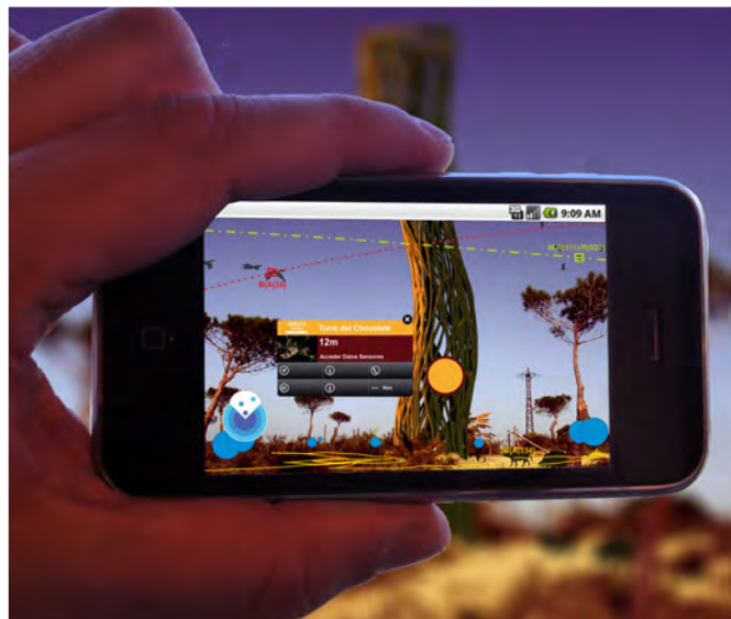
Torres y visualización en sistemas de Realidad Aumentada