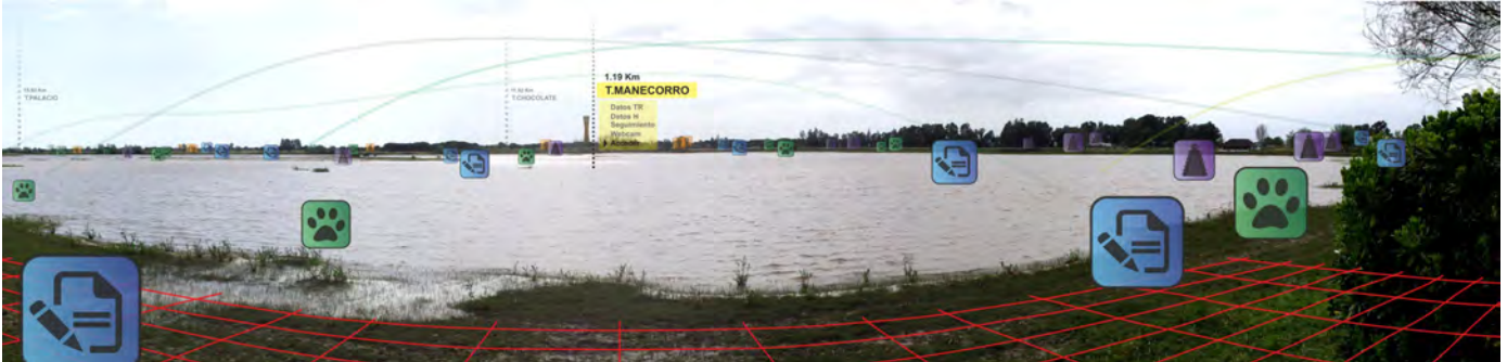
Simulación Realidad Aumentada App - Experimentación colectiva