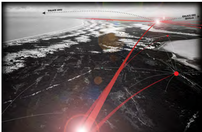
Torres-nodo en el territorio red