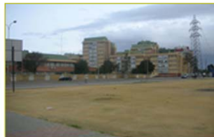
Explanada de los Rojos, Barriada R. Machado, Polígono Sur fuente Glez Arriero C.