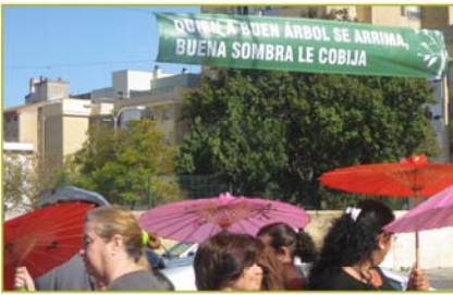
Taller de Sombras. Explanada de los Rojos Barrriada de Murillo Fuente Glez Arriero C.