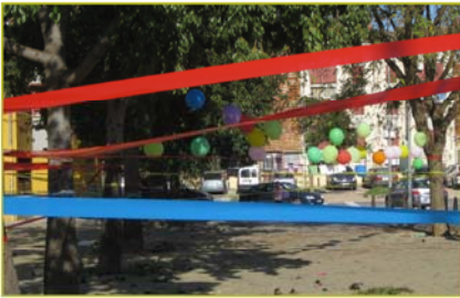
Taller Enrédate. Barrriada Machado Fuente Glez Arriero C.