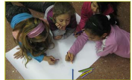
Imagen 6 Elaboración propia