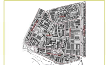
Polígono sur . fuente: elaboración propia