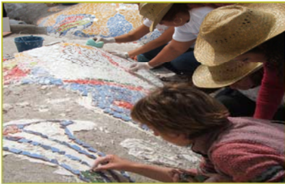
Jorobas de los Rojos, PSur.