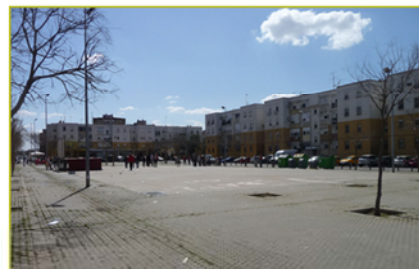
Plaza Dolores Ubarrun, barriada Las Letanias Polígono Sur

En este sentido, el Polígono Sur parece que podría ser un caso paradigmático de las etapas de transición de la habitabilidad contemporánea, es decir: de contenedor gestionado para el alojamiento, al ensayo político de una gestión propia e integrada del ámbito urbano. En este sentido, la capacidad para promover la participación ciudadana dentro de las políticas de actuación es uno de los grandes temas de los que podríamos aprender.