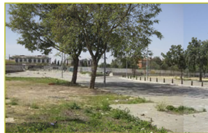
Explanada barriada Murillo, Polígono Sur fuente Glez Arriero C.