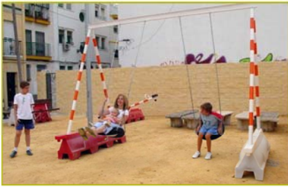
Recetas Urbanas.