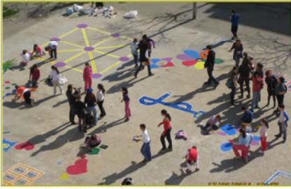
Taller pintura. Plaza Dolores Ibarruri Elaboración propia