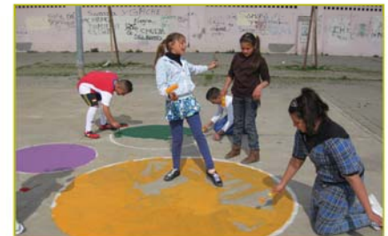
Imagen 7. Elaboración propia