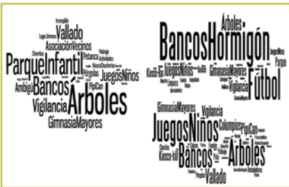
Resultado de los talleres. Nube de tags