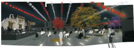
Plaza de San Pedro