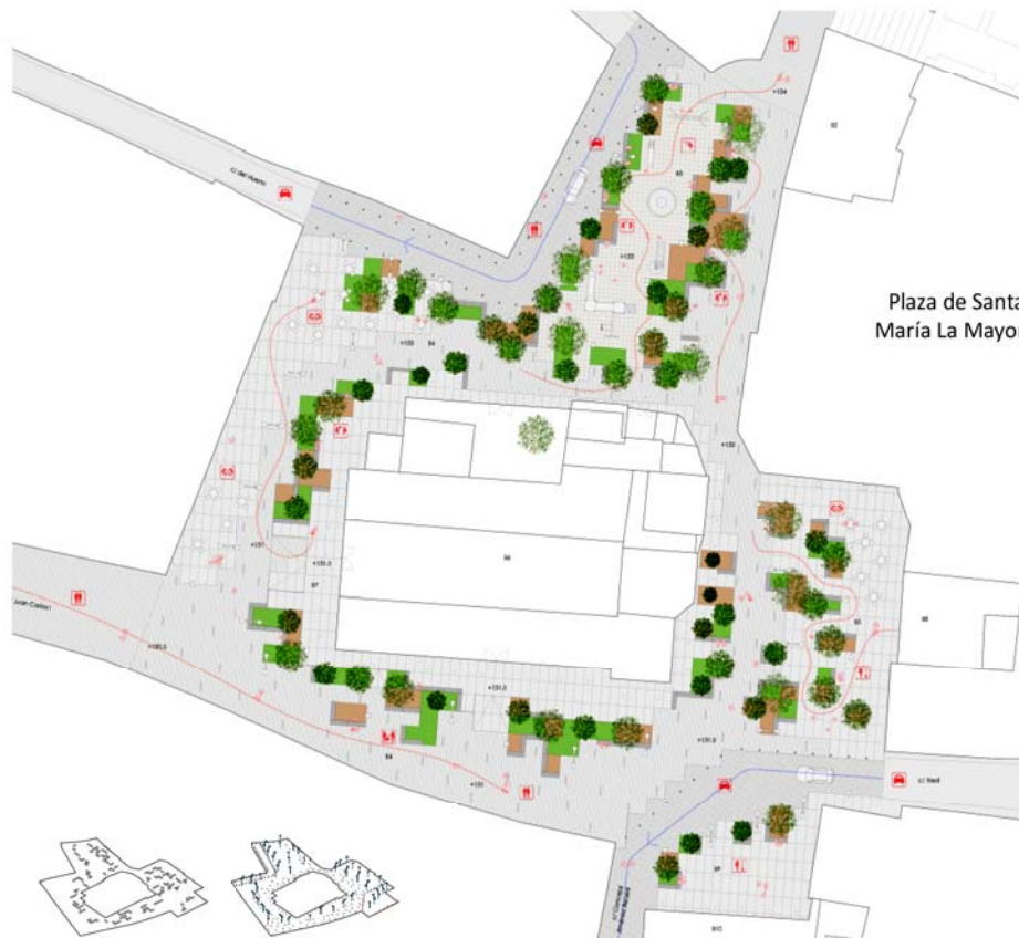
Plaza de Santa María La Mayor