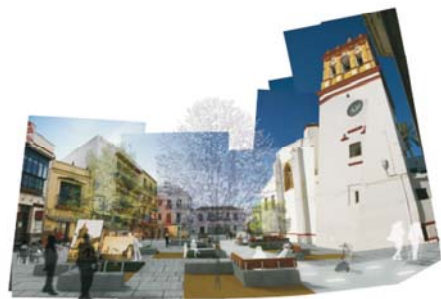
Plaza de Santa María La Mayor (delante)