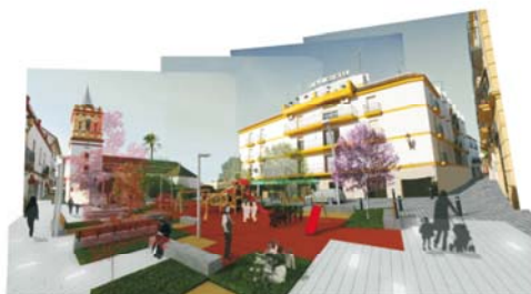
Plaza de Santa María La Mayor (detrás)