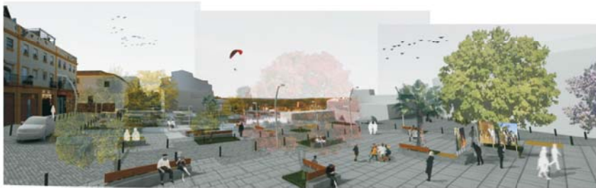
Parque de La Cárcava